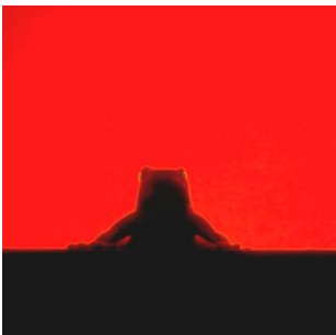
© Juan Pablo Cheret. Sin Título de la serie "Intruders" - 2008

Profesora de Arte Contemporáneo (Universidad de Buenos Aires.), Investigadora y Curadora Independiente